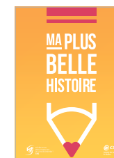
Ma plus belle histoire