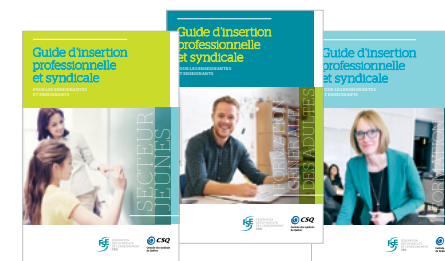
Guides d'insertion professionnelle et syndicale