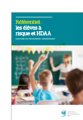
Référentiel : les élèves à risque et HDAA