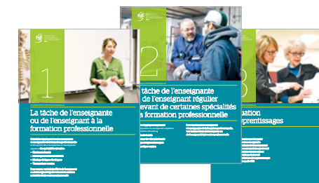
Fiches d'information pour la formation professionnelle (9)