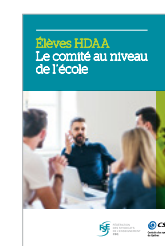
Le comité au niveau de l'école