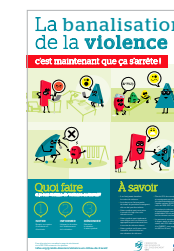
Affiche de prévention de la violence à l'école