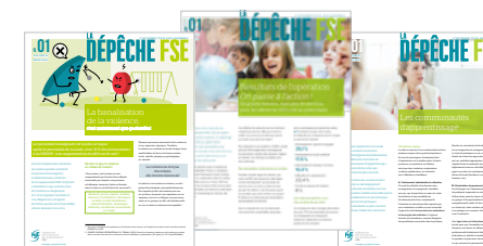
La Dépêche FSE