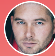
MANU MILITARI, PARRAIN DE L'ÉDITION 2021-2022